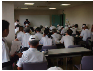
▲ 開始前の打ち合わせ