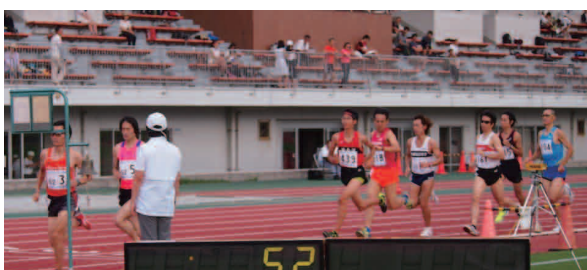
▲ 壮年男子 1500m