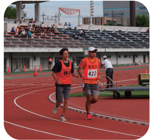
絆〜ロープに託して