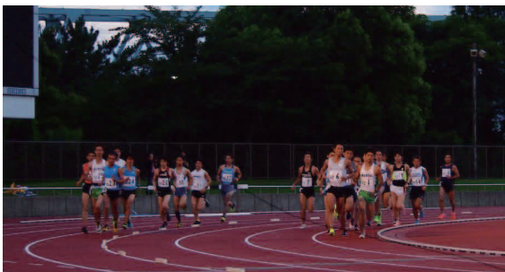
▲ 夕闇迫るなか、5000mのスタート